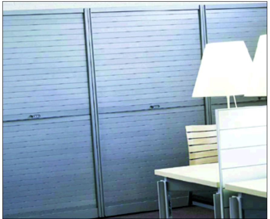
Rolladenschränke KRS in grau

Die solide Konstruktion verleiht der KRS-Serie eine große Formbeständigkeit. Dadurch können die Schränke jederzeit problemlos ohne Stabilitätsverlust umgestellt werden.