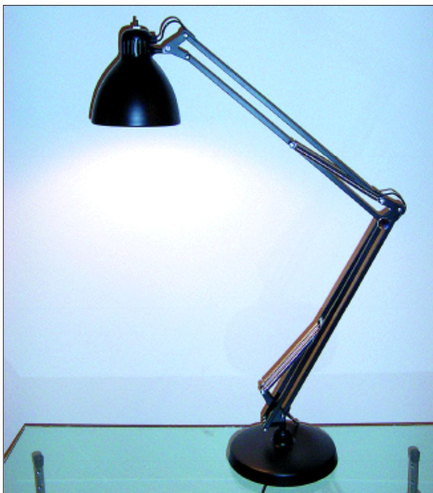
L1 schwarz mit Tischfuß