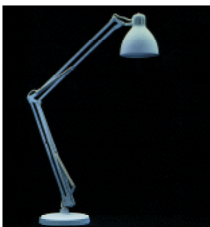
L1 weiß mit Tischfuß